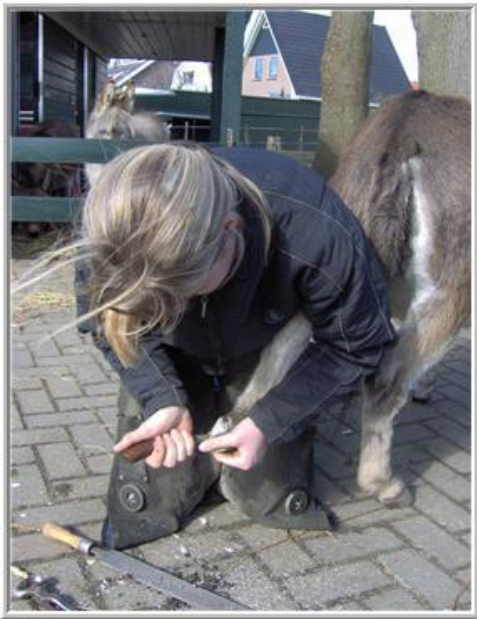
*hoefsmid aan het werk*

Ook voor de nodige goed hoofverzorging, moet je van te voren een goede hoefsmid zoeken die ervaring heeft met ezelhoefjes.