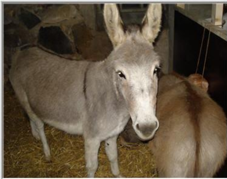
*Roncette kijkt op, goedemorgen!*