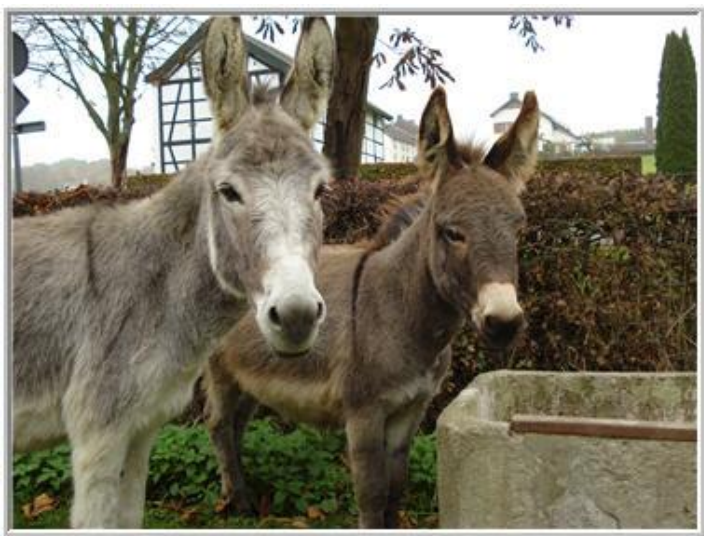
*samen bij de oude drinkbak*