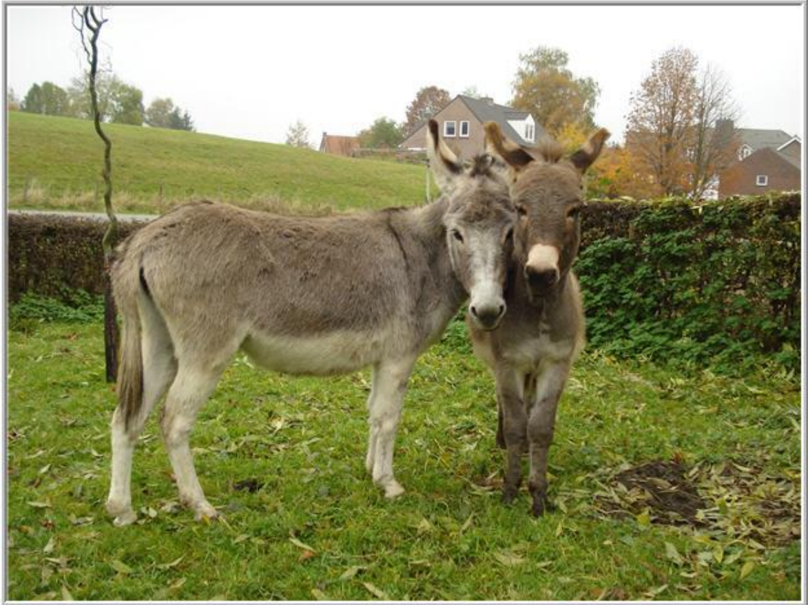
*lief duo Roncette en Lisa*

Ik zou nog veel en veel meer kunnen en willen vertellen over Roncette en Lisa, wat ze doen, hoe het met hun gaat, hoe ze zich gedragen, en nog veeeeeeeeel meer. Maar nu eindig ik dit verhaal van de maand, met nog extra foto's, dan kun je alvast zelf zien, hoe hun eerste weekje is geweest.