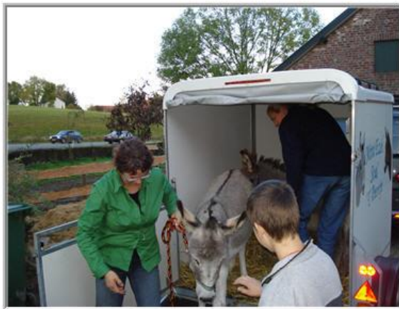
*Roncette komt als 1e uit de trailer*