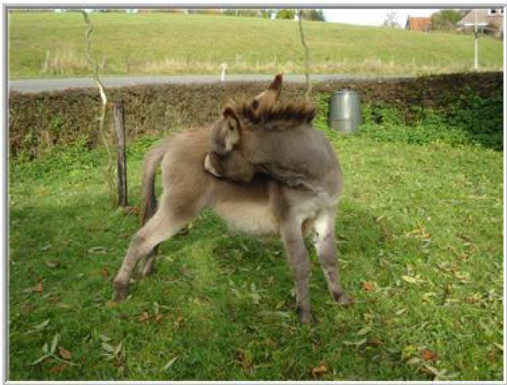
*Ik doe het wel even met mijn eigen tanden*