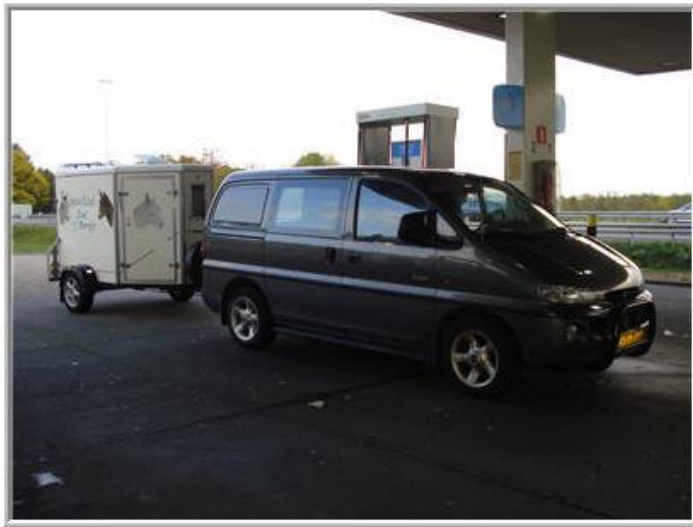
*onderweg even tanken en door het trailer raampje spieken*