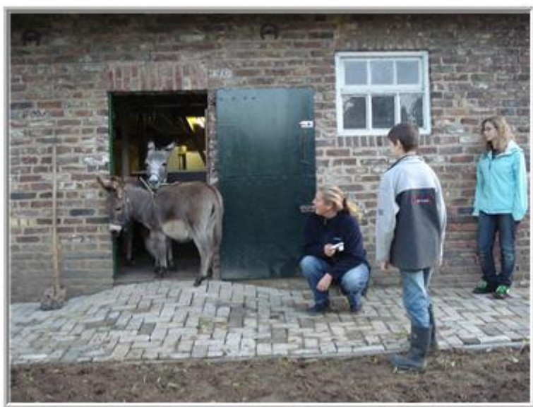
*even rustig in en uit de stal lopen*