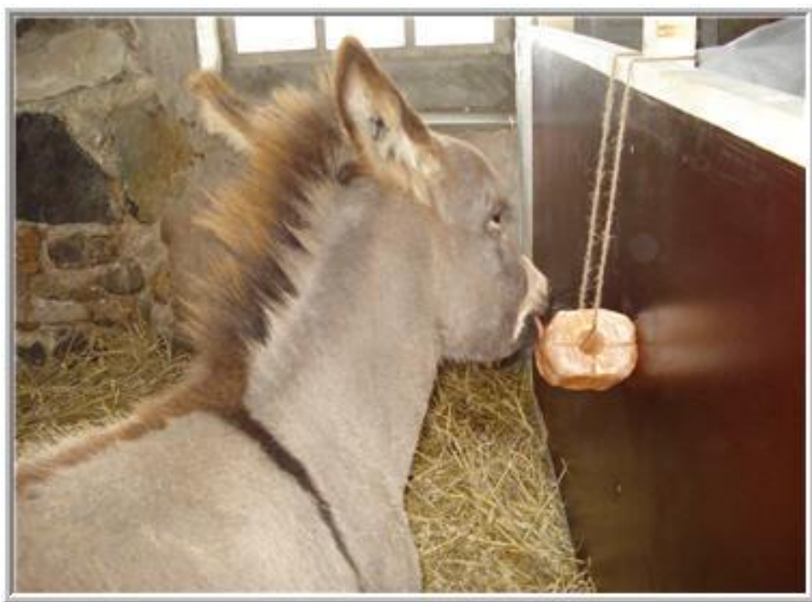
*Lisa in de stal lekker aan de liksteen*