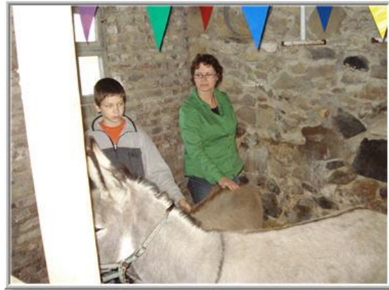
*In de versierde box even wennen*