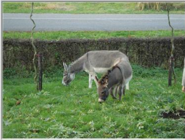
*lekker samen grazen*

Zelf de buik van Roncetje kun je horen boebelen op afstand. Gelukkig krijgen de dametjes al snel ook gewone gezonde stevige ezelvijgen. Ze eten goed, drinken goed, en poepen goed. Ze zijn heerlijk knuffelbaar, dus wat willen we nog meer.