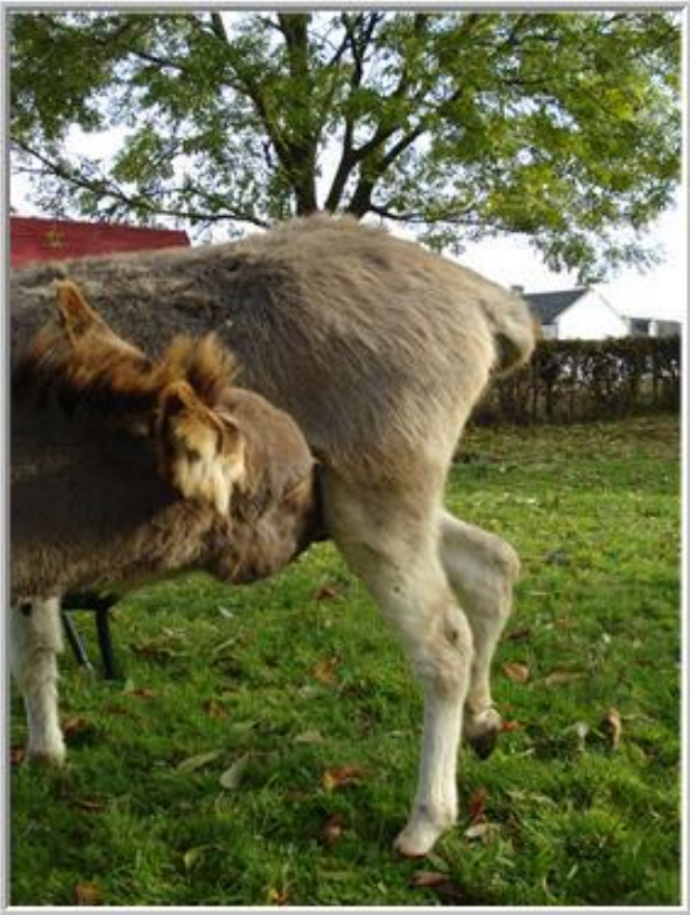
*Even kijken of er bij Tante Roncette nog wat melk te pikken is*