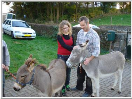
*Welkom in Epen meiden!*