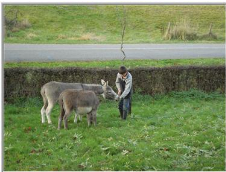
*Stijn met de meiden*

Alhoewel ik het idee heb dat de meiden er al vanaf het begin rustig bijstaan, merk ik eigenlijk na een dag of 3 dat ze nog meer contact gaan zoeken. Ook dan zie ik dat ze nog meer ontspannen zijn dan de eerste 3 dagen. Het is harstikke leuk dat ze steeds vaker en sneller naar ons toe komen voor een knuffel, kriebel of borstelbeurt.