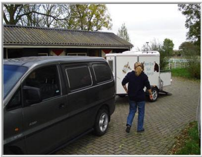
*de trailer staat al klaar*

Zondag 25 oktober 2009. Zoals ik al in het dagboek heb geschreven, is het inladen van de ezeltjes in de trailer goed gegaan. Lisa die nog nooit in de trailer is geweest, stond er zelfs als eerste in. De dappere Dame. Als we vertrekken vanuit Assendelft, staan de meiden er heel rustig en ontspannen bij. En ook de hele reis naar Epen, blijven ze rustig, en dat geeft ons een heel fijn gevoel.