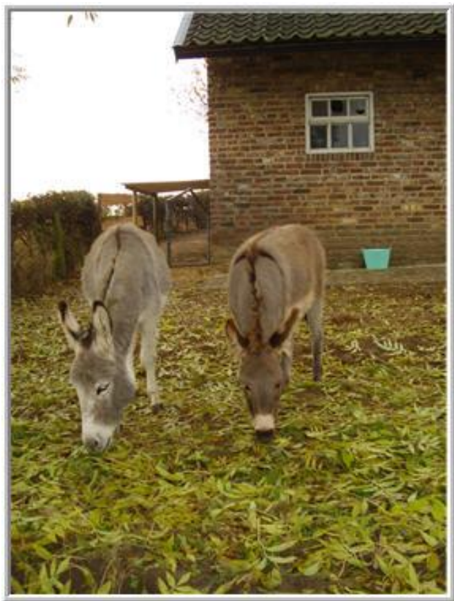
*nou die blaadjes zijn ook lekker!*