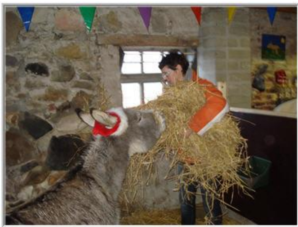
*kom maar op met dat extra dik strobedje*

Als de meiden op stal staan, laat ik altijd nog even het licht aan. Wat later op de avond, ga ik bij ze het licht uitdoen.