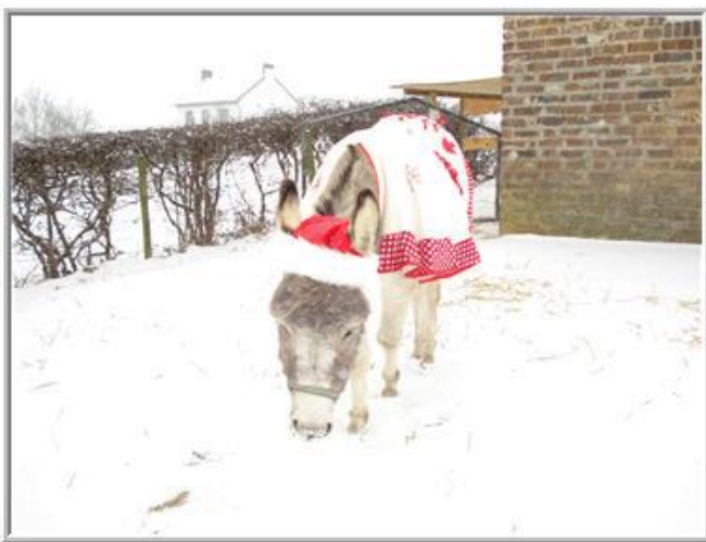
* onze eigen winter-ezel Roncette, in stijl*