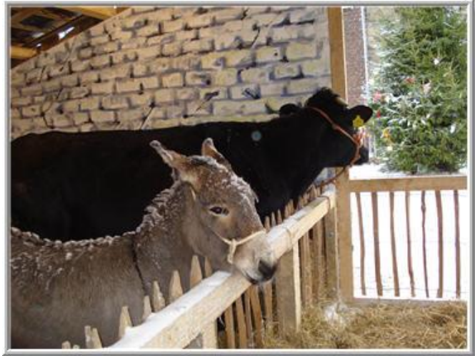
*de ezel en de os in de stal*