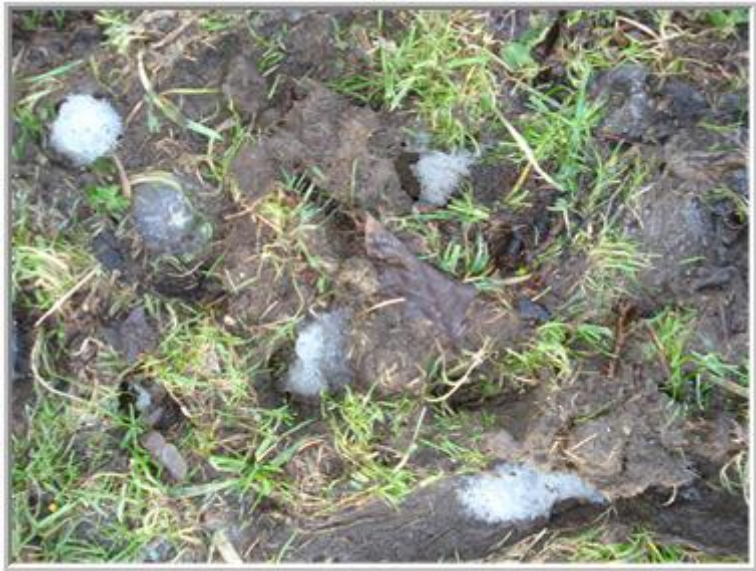
*bevroren hoefadrukjes met ijs*

Ook hadden wij stoeptegels liggen, op het pad achter de schuur. Door bevriezing werd dit geen veilige doorloop voor de ezelmeiden. De stoeptegels werden glad. Voor de vorst was er een periode met veel regen. Hierdoor was het rondom de tegels een modderzooitje geworden. En alles bevroor tot een bobbelige ijsbaan. Iets om je poten op te breken, dus ik heb in ieder geval de stoeptegels verwijderd. Alleen in de weide zelf, zijn de voetstapjes van de hoefjes bevroren. Hiervoor was ik té laat om het plat te krijgen. De afdrukken in de modder vormden nu ook in de wei een bobbelige ijsbaan. Toen de sneeuw weg was, bleef er ijs in de holtes van de hoefafdrukken achter. Ik lijkt er meer last van te hebben dan de ezels, die lopen heel voorzichtig en rustig over de ijsbobbels heen, terwijl ik me zorgen maak over hun hoeven en pootjes.