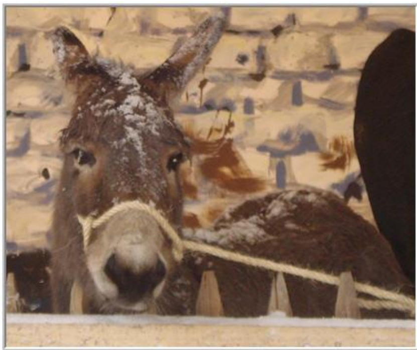
*sneeuw blijft op de vacht liggen*

Gelukkig zie ik ook dat ze na het grazen, vanzelf de droge stal opzoeken met hun buikjes gevuld.