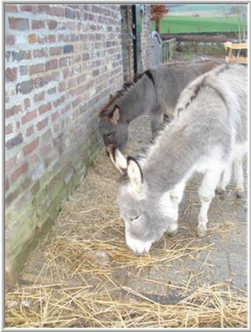
*droogloop bij de stal*

De droogloop voor de stal, gaf met dit winterweer wel problemen. Ik heb de klinkers proberen ijs en sneeuwvrij te houden, door veel te vegen met de straatbezem, en geel zand erop te strooien om gladheid tegen te gaan. Nu kunnen de meiden zonder te glijden lopen.