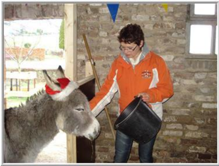
*Roncette komt de lege emmer checken; vullen graag!*

Juist omdat ze veel hooi krijgen, moeten ze meer kunnen drinken, dan als ze gras kunnen eten.