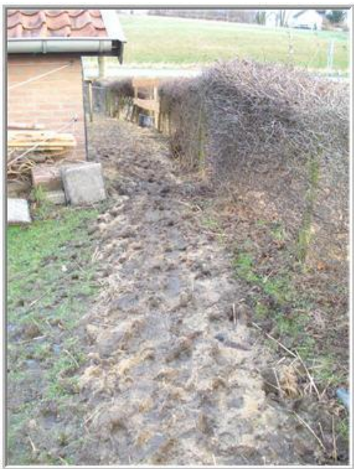
*pad achter de schuur *

De droogloop voor de stal, gaf met dit winterweer wel problemen. Ik heb de klinkers proberen ijs en sneeuwvrij te houden, door veel te vegen met de straatbezem, en geel zand erop te strooien om gladheid tegen te gaan. Nu kunnen de meiden zonder te glijden lopen.