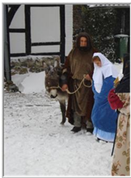
*de tocht door de sneeuw begint*