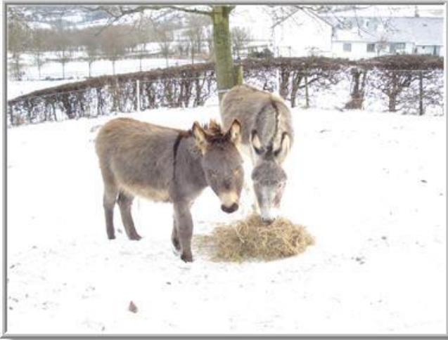
*hooibergjes zoeken in de wei*