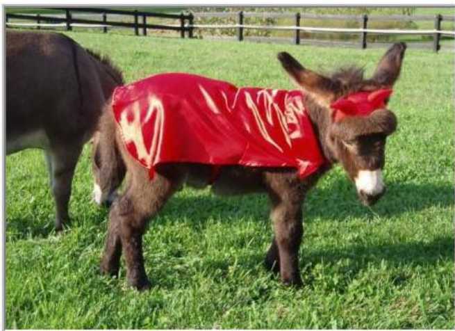
*jong geleerd, is oud gedaan*

Neem genoeg tijd, om je ezel te laten wennen aan het dragen van kleding.