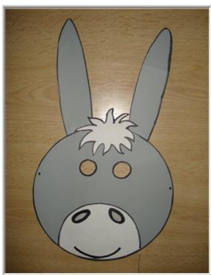
*plak het met lijm aan elkaar en klaar!*