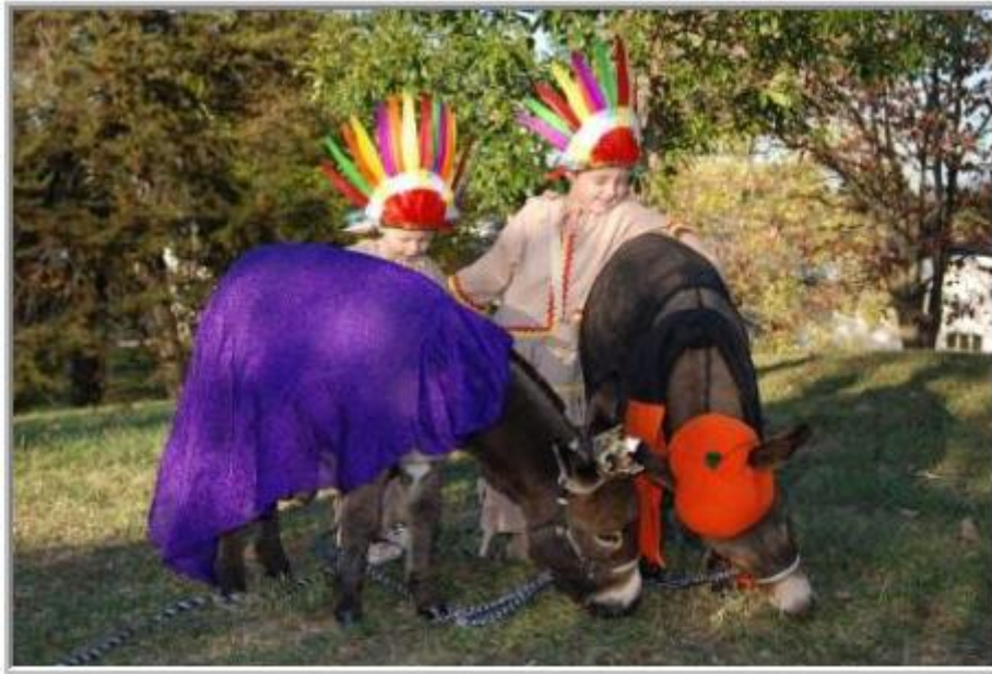
*prinsesje mét kroontje, en een pompoen koppie, met hun indianen vriendjes*