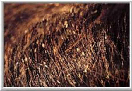
*Eitjes van de luis op de haren *