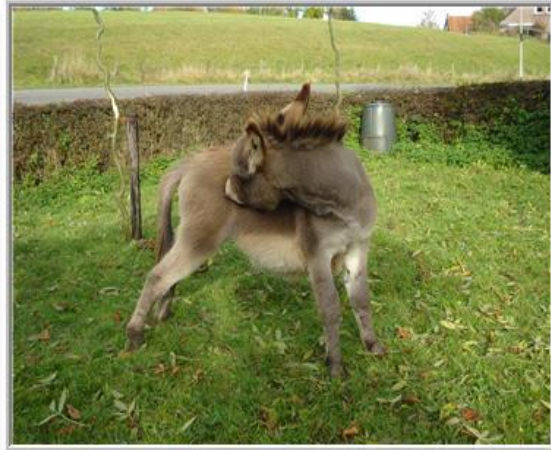
*met de tanden "krabben" kan ook *