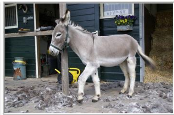
*en na de scheerbeurt*