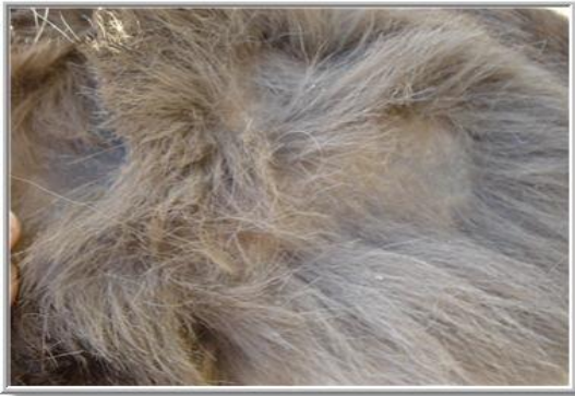
*kale plekken bij Lisa*

Als een ezel problemen heeft met zijn huid of met zijn vacht, dan moet dit uiteraard worden aangepakt. Ook al laat de ezel niet duidelijk merken dat hij er last van heeft. Er zijn heel wat problemen op te sommen, die voorkomen bij ezels.