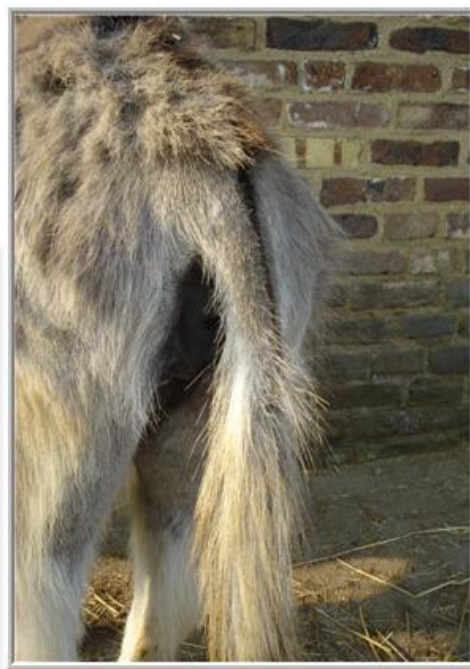
*kale staart bij Roncette*