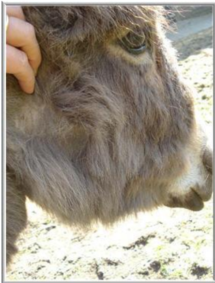
*Lisa heeft kale plekken*