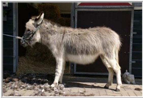
*roncette vóór het scheren*

Indien nodig kun je die schoonmaken met een vochtige doek met lauw water. Op kleine schuurplekjes of wondjes kun je wat zalf smeren. Sudocreme is makkelijk in gebruik, maar je zult wellicht ook wat anders kunnen gebruiken.