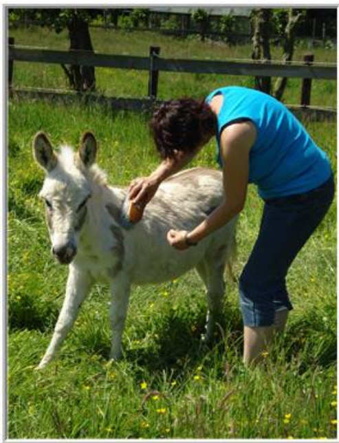
*lekkere borstel beurt*