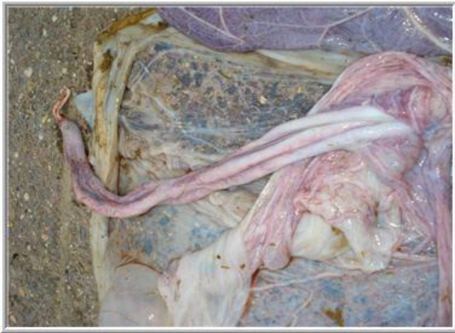
*Vliezen en navelstreng*

Ik zag geen "broekspijpen" maar een mooie ronde vorm. De dierenarts heeft alles gecontroleerd, en de nageboorte mooi weer op elkaar gelegd. Zo kon ze constateren dat er niks was achtergebleven. Ze heeft de navelstreng bekeken, en ons gewezen waar de bloedvaten en het urinekanaaltje zaten. We konden mooi de witte blauwige kleur van het vlies zien, het is zo dun, en is toch een jaar lang stevig geweest en het veulen mooi omhuld.