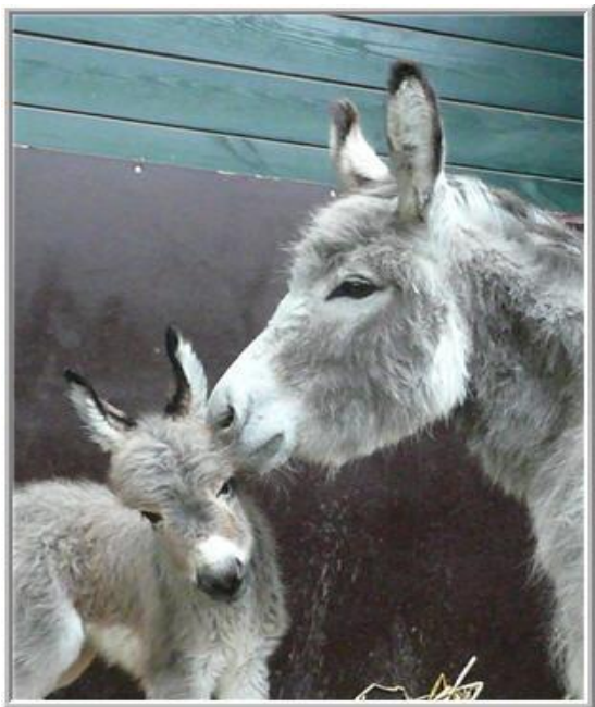
*Roncette met haar 1e veulen Beau*

In de weken en maanden daarna blijft het verstandig minstens éénmaal per dag merrie en veulen te controleren om eventuele problemen tijdig te ontdekken. Zieke veulens kunnen heel snel slechter worden, terwijl de meeste problemen goed te behandelen zijn. Wacht dus niet te lang af!