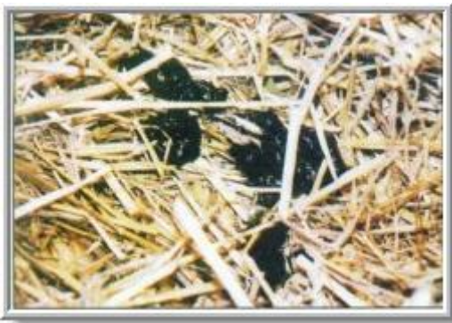
*darmpek is de 1e zwarte kleverige mest*

Darmpek wordt ook meconium genoemd. Dit is de darminhoud waarmee een veulen geboren wordt. Gedurende de dracht drinkt het veulen van het vruchtwater, en maakt zo zijn eerste mest aan. Deze mest is kleverig en zwart van kleur en moet na de geboorte binnen 12 tot 24 uur afkomen, anders kan het veulen koliek krijgen. Veulens die koliek krijgen van het niet afgekomen darmpek gaan vaak op hun rug liggen. Als het darmpek niet vanzelf afkomt moet er een klysma toegediend worden. Dit is een vloeistof die het darmpek zacht en glibberig maakt, en wordt via een slangetje in de anus ingebracht. Aangezien het darmweefsel van een veulen erg teer is, is het raadzaam om in een dergelijk geval de dierenarts in te schakelen en hem deze klysma toe te laten dienen.