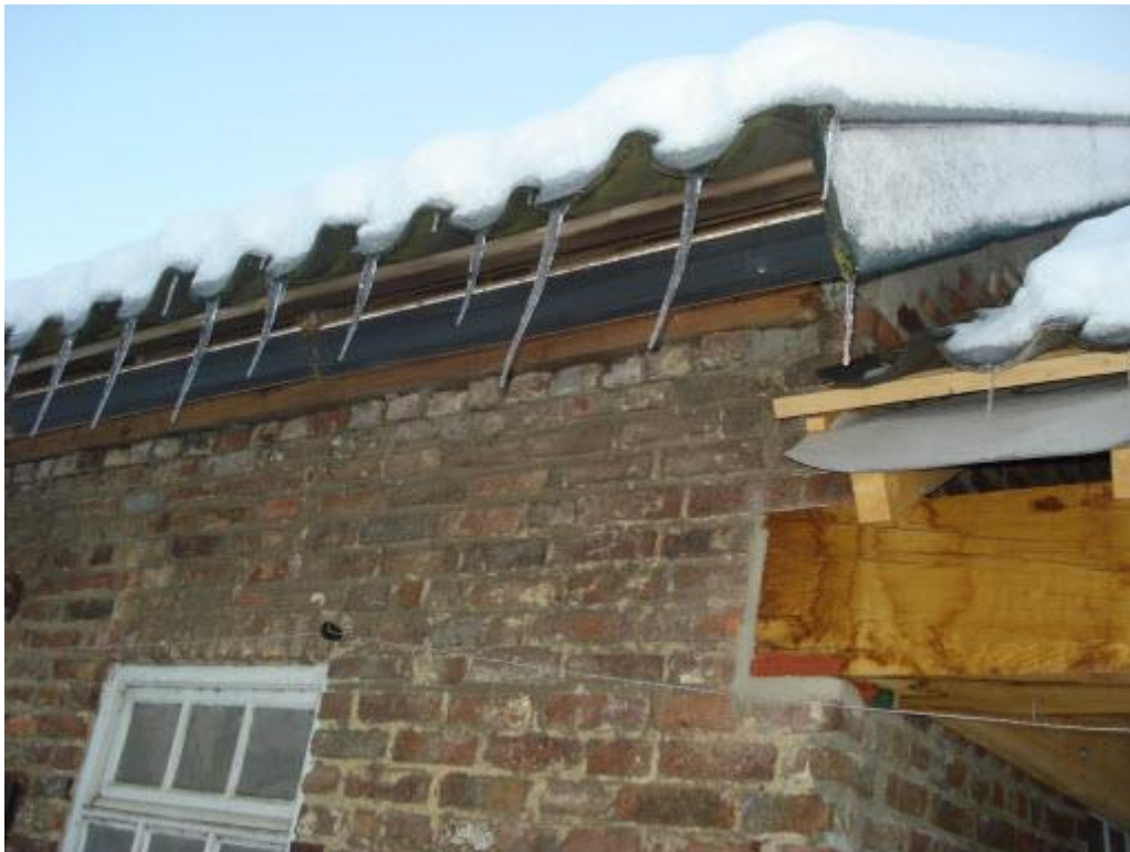
*ijspegels bungelen aan het staldak*