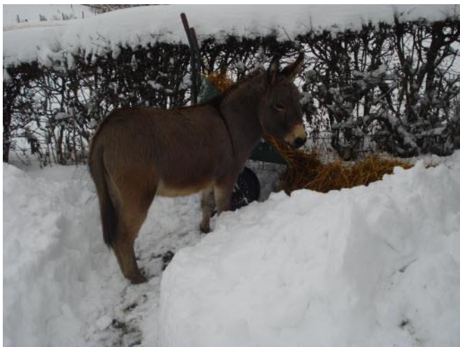
*Lol, kruiwagentje omduwen!*

Wel interessant om bezig te blijven vinden ze de drinkemmer als die leeg is, de kruiwagen die buiten staat (het liefst vol mest en dan omduwen), en natuurlijk een bezem of (sneeuw)schep die ik net even uit mijn handen moet zetten. De handschoenen van het vrouwtje zijn ook zeer geliefd! De banen van leeggescheppte sneeuwpaden, probeer ik te veranderen, of te vermeerderen, zodat ze ook daar steeds een uitdaging en afwisseling in vinden. Daar maken ze alle drie gretig gebruik van. Zo moeten we samen met en voor onze ezeltjes, de wintertijd maar wat aangenamer en makkelijker mee maken. En verstrijkt de tijd van zelf, tot dat de lente zich weer aan kondigt. We hopen dat iedereen veilig en zonder valpartijen van de winter naar de lente kan gaan. Uiteraard zijn aanvullende tips voor de winter ezeltjes altijd van harte welkom.