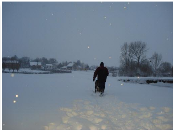
*winterwandelen met Quin*

Er zoveel sneeuw gevallen, dat vraagt om sneeuwpret...en niet alleen bij ons. Onze jongste spruit Fellow, heeft natuurlijk nog nooit sneeuw gezien. Dus voor hem was het een feest van ontdekken en ervaren wat dat witte spul nu allemaal was.