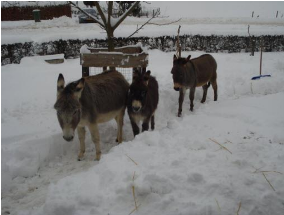
*paden in de sneeuw graven en strooien maar*