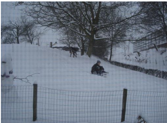
*roetsj de wei af op de slee*