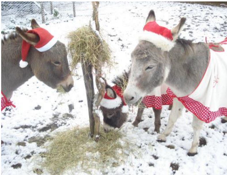
*kerst ezeltjes eten hooi*

De winterkou bracht natuurlijk niet alleen maar sneeuw en ijs, maar ook kou, soms fikse kou door de wind die erbij kwam, soms redelijk milde winterkou. Maar winter en kou, betekent ook dat onze ezeltjes hun lijfjes warm moeten houden.