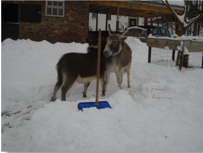
*leuk zo'n sneeuwschep*

Wel interessant om bezig te blijven vinden ze de drinkemmer als die leeg is, de kruiwagen die buiten staat (het liefst vol mest en dan omduwen), en natuurlijk een bezem of (sneeuw)schep die ik net even uit mijn handen moet zetten. De handschoenen van het vrouwtje zijn ook zeer geliefd! De banen van leeggescheppte sneeuwpaden, probeer ik te veranderen, of te vermeerderen, zodat ze ook daar steeds een uitdaging en afwisseling in vinden. Daar maken ze alle drie gretig gebruik van. Zo moeten we samen met en voor onze ezeltjes, de wintertijd maar wat aangenamer en makkelijker mee maken. En verstrijkt de tijd van zelf, tot dat de lente zich weer aan kondigt. We hopen dat iedereen veilig en zonder valpartijen van de winter naar de lente kan gaan. Uiteraard zijn aanvullende tips voor de winter ezeltjes altijd van harte welkom.