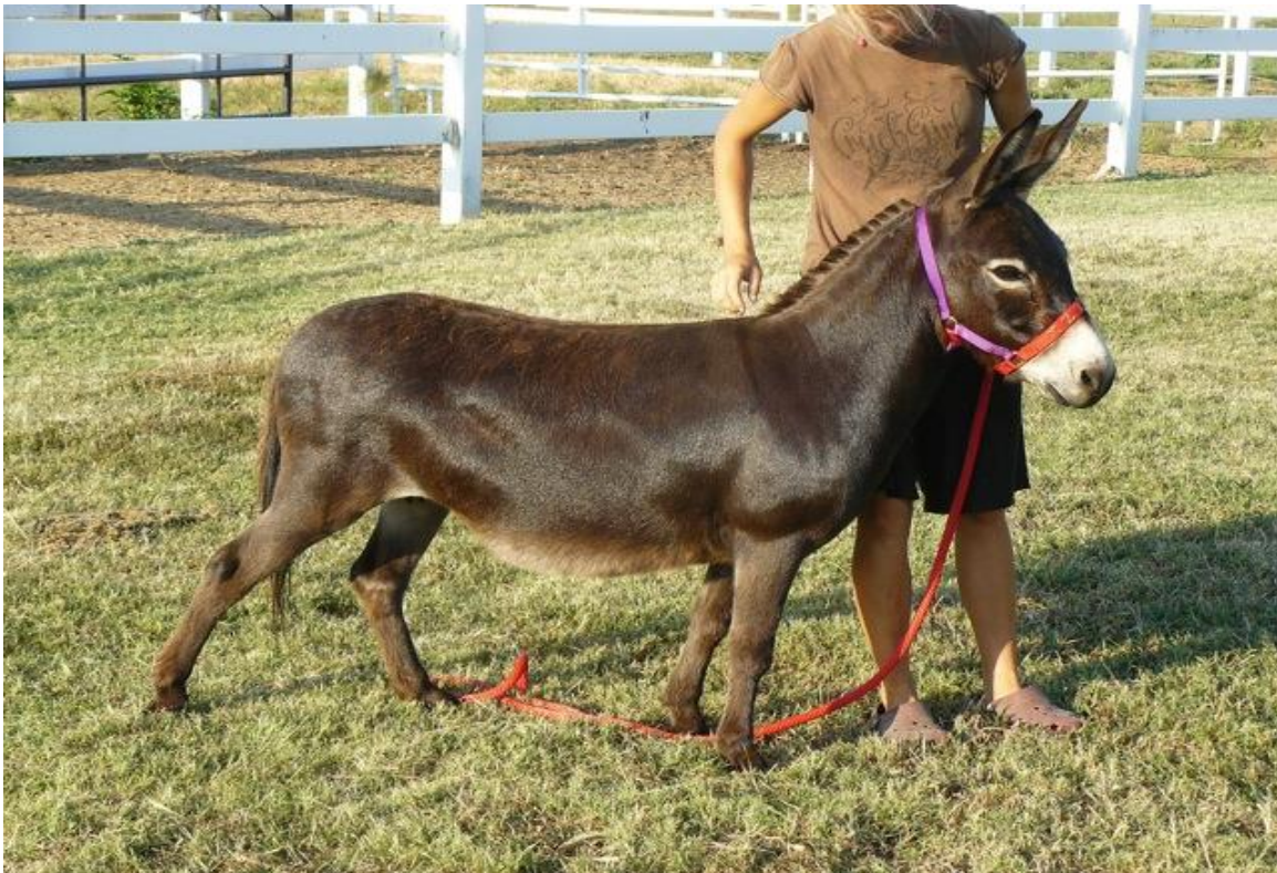
*Izzy blijft 4 weken bij Sheri's transport station*

Wist je dat ezels zeker voor minimaal 4 weken in quarantaine gaan? Ze reizen niet alleen, en krijgen een reisgenootje, waar ze meestal ook de quarantaine tijd mee doorbrengen. Er zal een geldende negatieve Coggin test uitslag moeten zijn voor je ezel, voordat hij/zij kan worden geïmporteerd. Zodat je ezeltjes geen EIA meebrengt naar Nederland. Dit is een paarden ziekte, een virus en heet Equine Infectious Anemia. Natuurlijk heb je nog meer papieren nodig, zoals een kopie of origineel Registratie papier van je ezel.