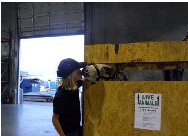
*Dag liefje, Goede Reis naar Luxemburg*