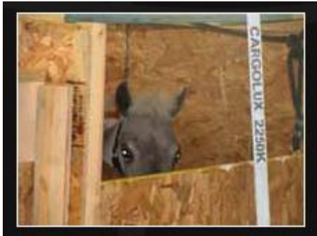
*veilig in kratten, met uitzicht*

Ezeltjes en ook mini paardjes worden in kratten vervoerd.