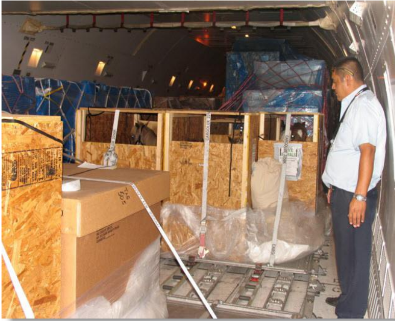
*kratten staan klaar voor vertrek*