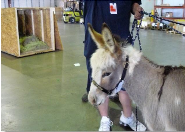
*heej kleintje, nu inladen in de loods, naar je kratje*