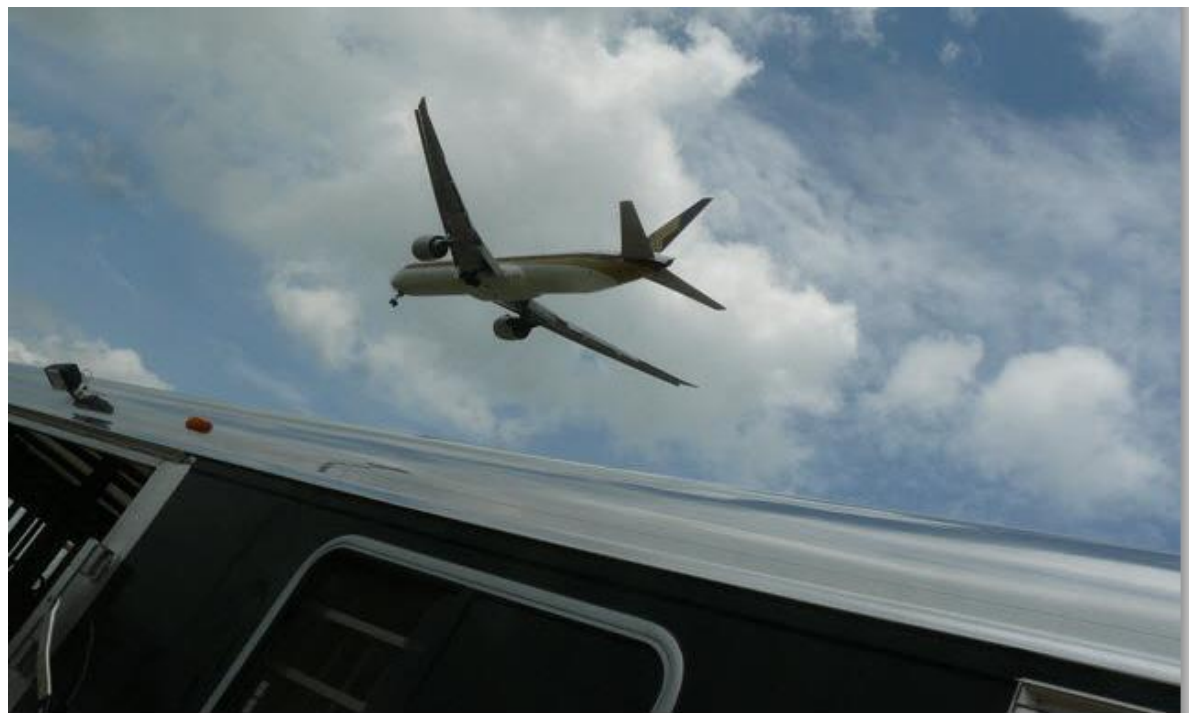
*Ready for take offffffffffffffffffffff*