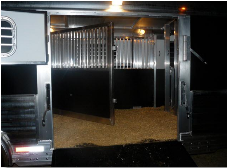
*binnenkant van de trailer*