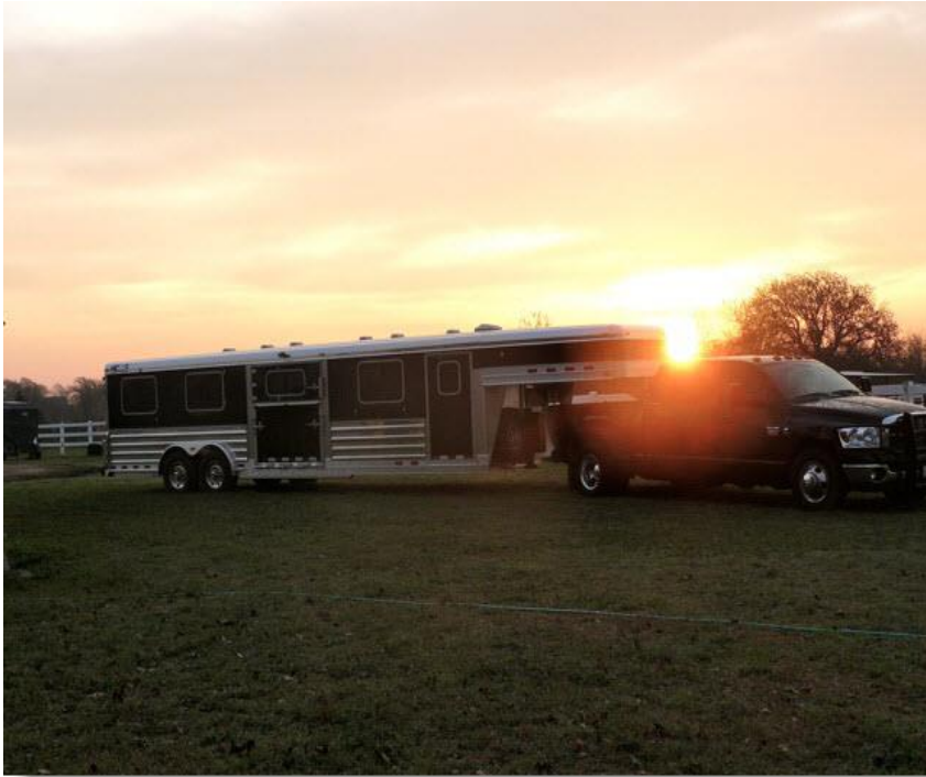
*5 uur in luxe trailer op weg naar het vliegveld*