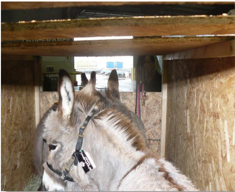
*zo kijken de ezeltjes naar buiten vanuit hun krat*